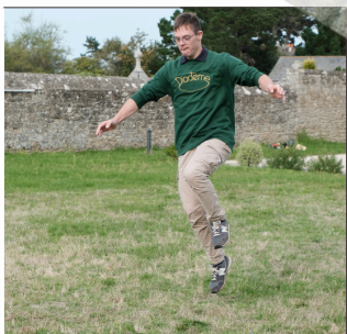
LE CÉLÈBRE BOND !