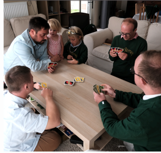
LE FAMEUX UNO