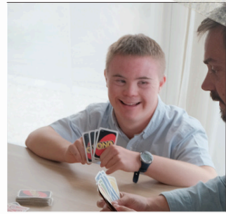
JE VAIS GAGNER !