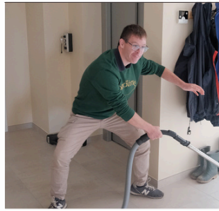
VIVE LE MÉNAGE !