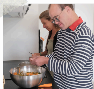
VIVE LES CAROTTES !