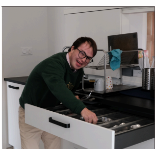
À TABLE 😊